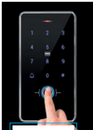
500 impronte digitali

Per diverse angolazioni di impronta digitale, identifica velocemente e accuratamente.