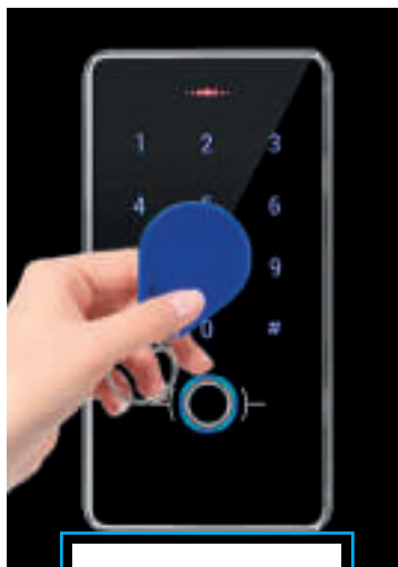
500 tessere RFID